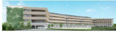
江東区立有明西学園